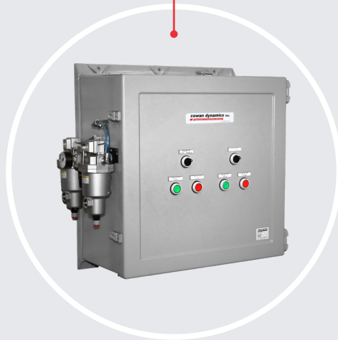
Panneau de commande pneumatique Cowan

Avec ou sans commande manuelle de surpassement locale